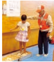
新聞紙スリッパ・ゴミ袋でカップ作り体験

令和6年8月3日(土) 甚目寺総合体育館において、「親子防災体験」を開催しました。特定非営利活動法人「あま市防災ネット」との協力のもと、当日は親子76名が参加いただき、様々な体験を通じて、楽しみながら防災について学びました。