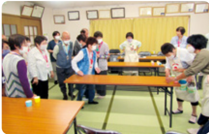
ふれあい・いきいきサロン支援事業