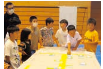
避難所運営ゲーム体験