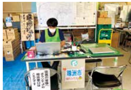
▲相談記録作成の様子

今回の被災地支援の経験から、あま市においても万が一被災等があった時、本会として迅速に適切な対応を図り、いち早い復旧・復興を目指せるよう、尽力していきたいと考えております。