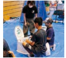
簡易トイレ作り体験