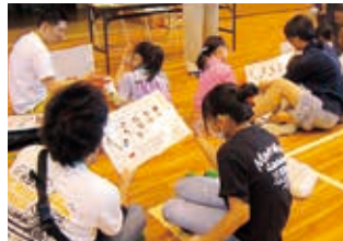
コミュニケーションボード 利用体験