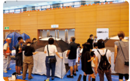
親子防災体験事業

その他、入学祝品贈呈事業、車いす専用車の貸出、心身障がい児・者クリスマス会、福祉人材育成事業(介護職員初任者研修)などを実施しています。