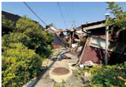
▲珠洲市の被害状況

珠洲市では、最大震度6強の地震と津波の被害を大きく受けており、本会職員が派遣に入った時も、壊れた家屋が多く残っていたり、ライフラインの復旧が進まず、多くで断水が続いていたり、まだまだ被災の痕跡が強く残っている状態でした。また、仮設住宅の完成も追いついておらず、被災した住民は市外や県外への避難を余儀なくされました。珠洲市では住民同士の結びつきが強く、「知っている人がみんなバラバラになってしまい寂しい」といった声も多く聞こえました。そんな中でもいずれまた地元の珠洲市に帰ってきたいと思って、壊れた家の片付けなどをボランティアに依頼する方もおり、そんな思いに応えるように平日は一日約100名、休日は約150名の災害ボランティアが、いち早い復興を目指して日々活動しています。