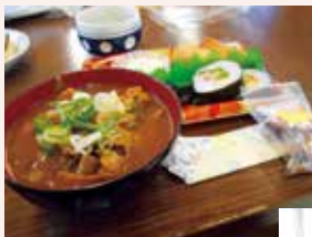
3食バランスを考えた食事、仲間と食事も大切