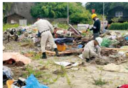
▲ボランティア活動の様子