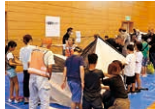
避難所テント作り体験