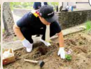
季節の花植え（日草）