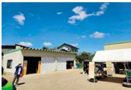
▲災害ボランティアセンターの外観

本会より派遣された職員は、電話や窓口にて被災された方からの相談受付や、実際に自宅まで赴き、現場状況の確認などを行いました。他にも、災害ボランティアセンターではボランティアへ活動の依頼や、活動内容に応じて軽トラックやヘルメット、シャベルなどの資材の貸し出しを行っています。