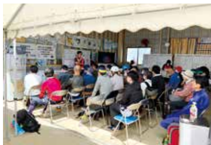
▲全国からの駆け付けボランティア