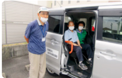
あまのかけあしS (移動援助サービス事業)