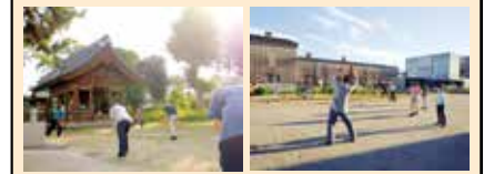
近くでラジオ体操しとると聞いたなあ