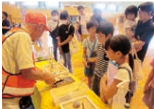
地形・液状化現象の実験