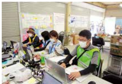
▲現場状況確認後のPC入力の様子