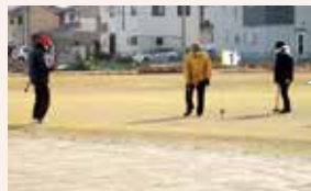
適度な運動、仲間との交流も大切