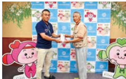
今善トラクター様

みなさまからお寄せいただきましたご寄附は、社会福祉事業推進、高齢者・障がい者福祉事業等に活用させていただきます。ありがとうございました。