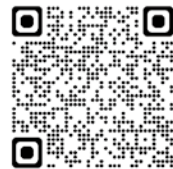
▲申込二次元コード